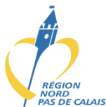
Région Nord/Pas-de- Calais